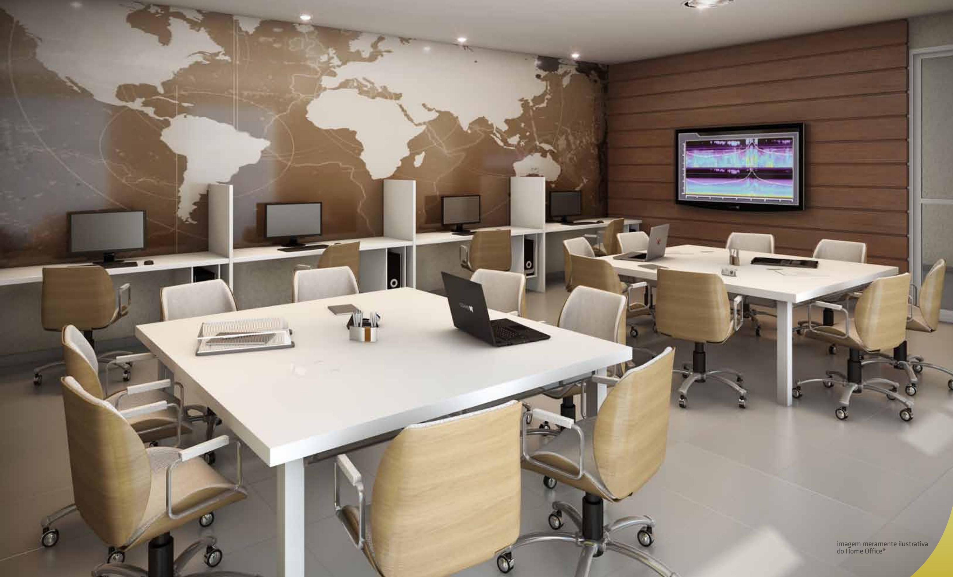
imagem meramente ilustrativa do Home Office*