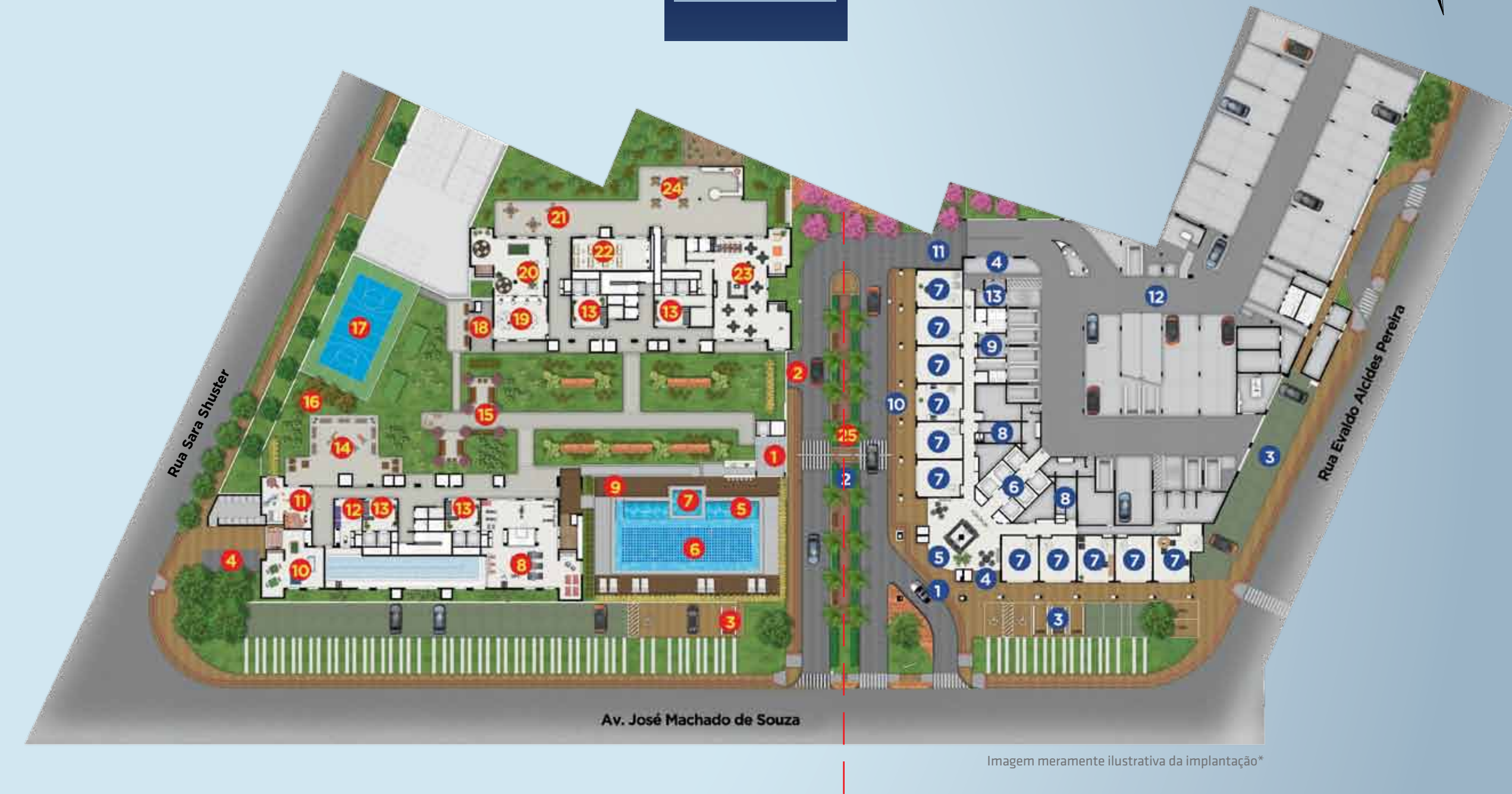
Imagem meramente ilustrativa da implantação*