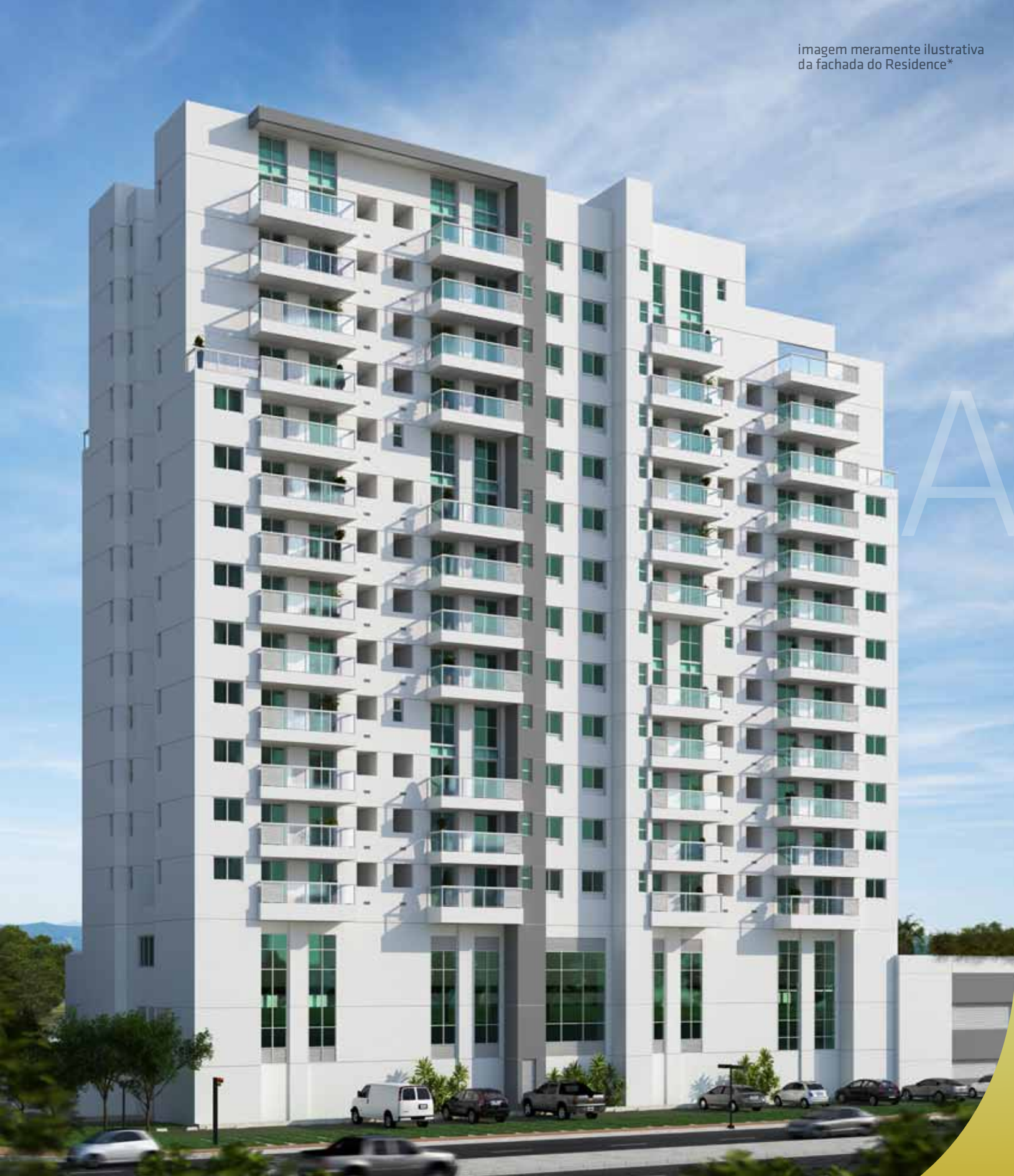
imagem meramente ilustrativa da fachada do Residence*