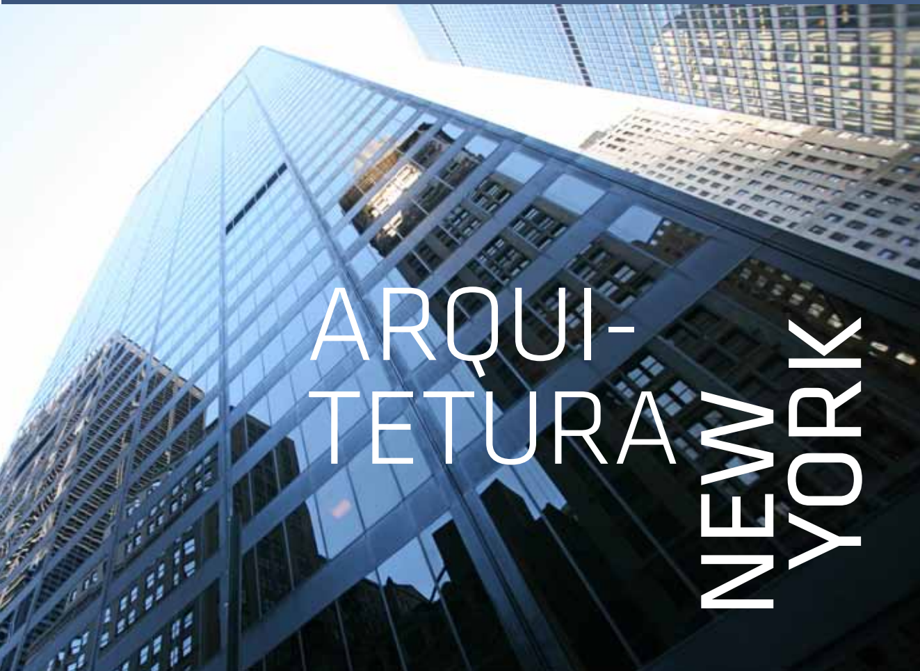
Imagem meramente ilustrativa: Nova Iorque

DE REFERÊNCIAS INTERNACIONAIS, NASCE EM ARACAJU UM NOVO ÍCONE.