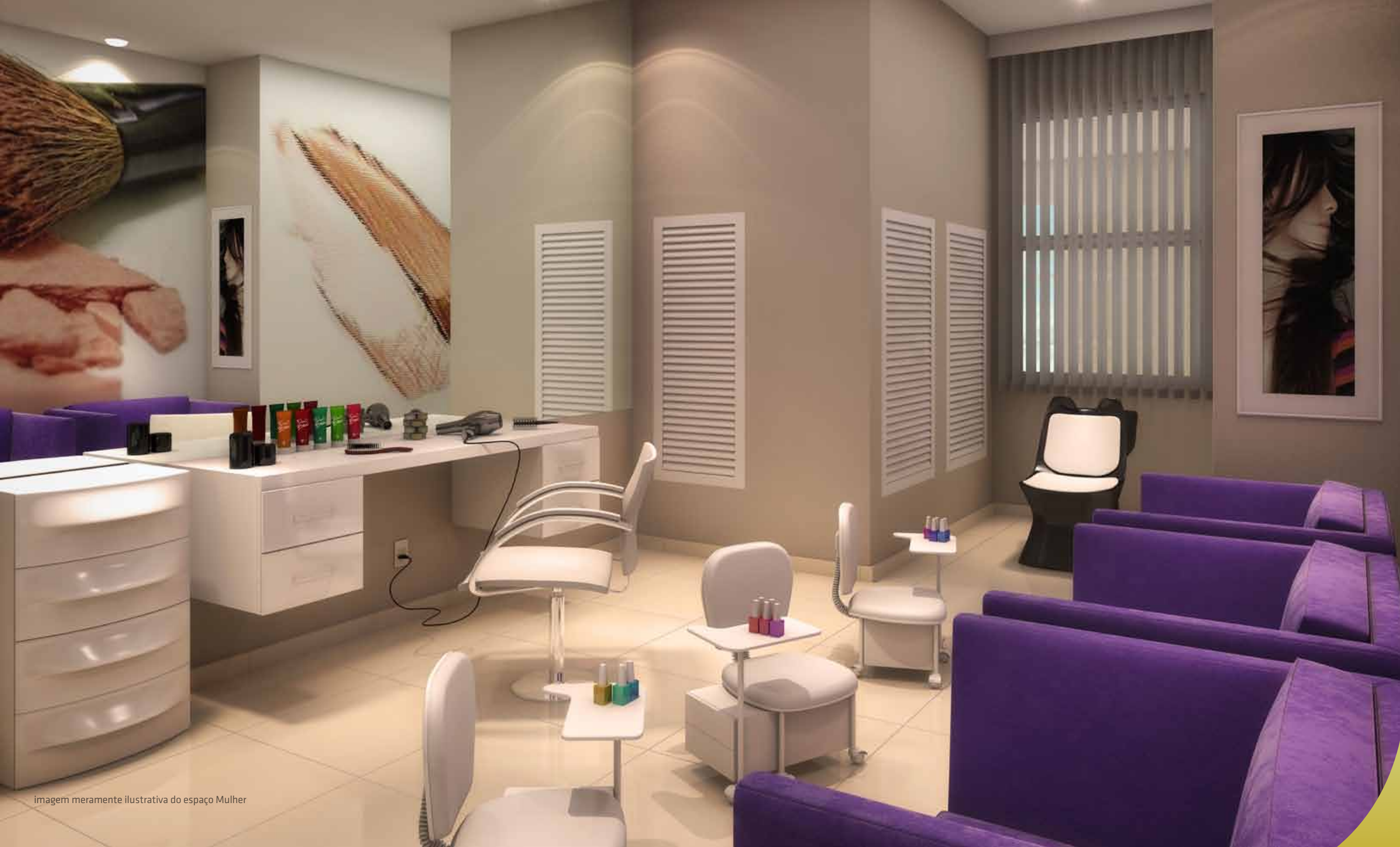
imagem meramente ilustrativa do espaço Mulher