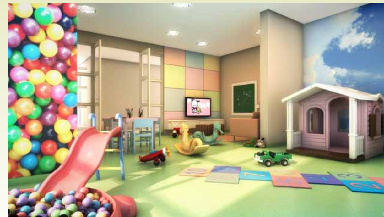
imagem meramente ilustrativa da brinquedoteca*

*Imagem meramente ilustrativa com sugestões de decoração e podem sofrer alteração de cor, formato e acabamentos. Móveis, eletrodomésticos, decoração, utensílios e objetos são de dimensões comerciais e não fazem parte do contrato de aquisição. Este ambiente não será entregue equipado e mobiliado, consulte memorial descritivo.