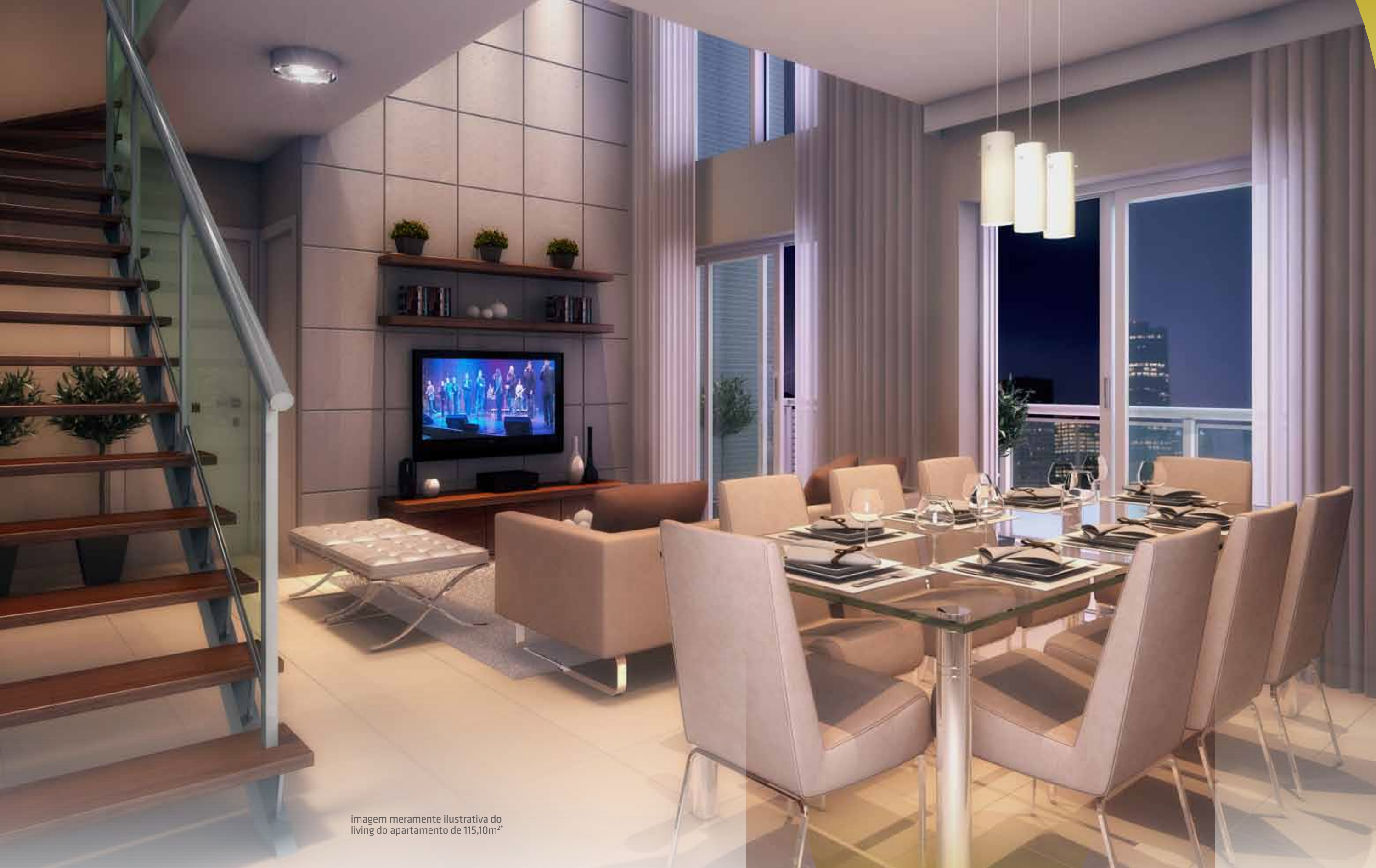
imagem meramente ilustrativa do living do apartamento de 115,10m 2