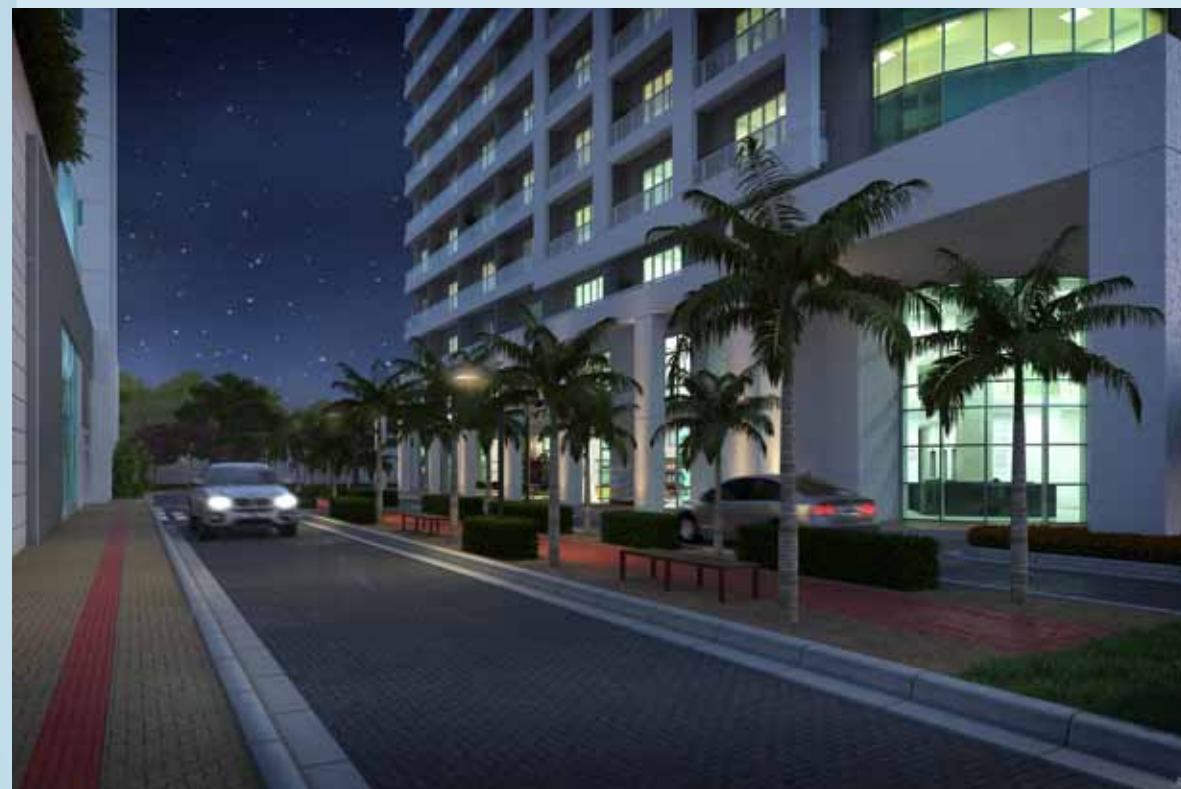
Imagem meramente ilustrativa do boulevard. O boulevard de acesso será regime de servidão nos termos registrados na matrícula.

Com traços elegantes e uma arquitetura arrojada, o Neo Jardins é a expressão moderna do que existe de mais ousado e encantador. Sua localização privilegiada, a poucos metros do shopping Jardins, proporciona a mobilidade urbana e a facilidade contemporânea que a sua vida merece. Permita se encantar pelo belo e viva à frente do seu tempo.