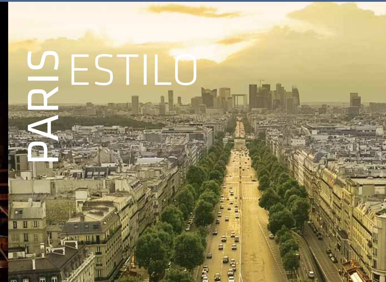
Imagem meramente ilustrativa: Paris