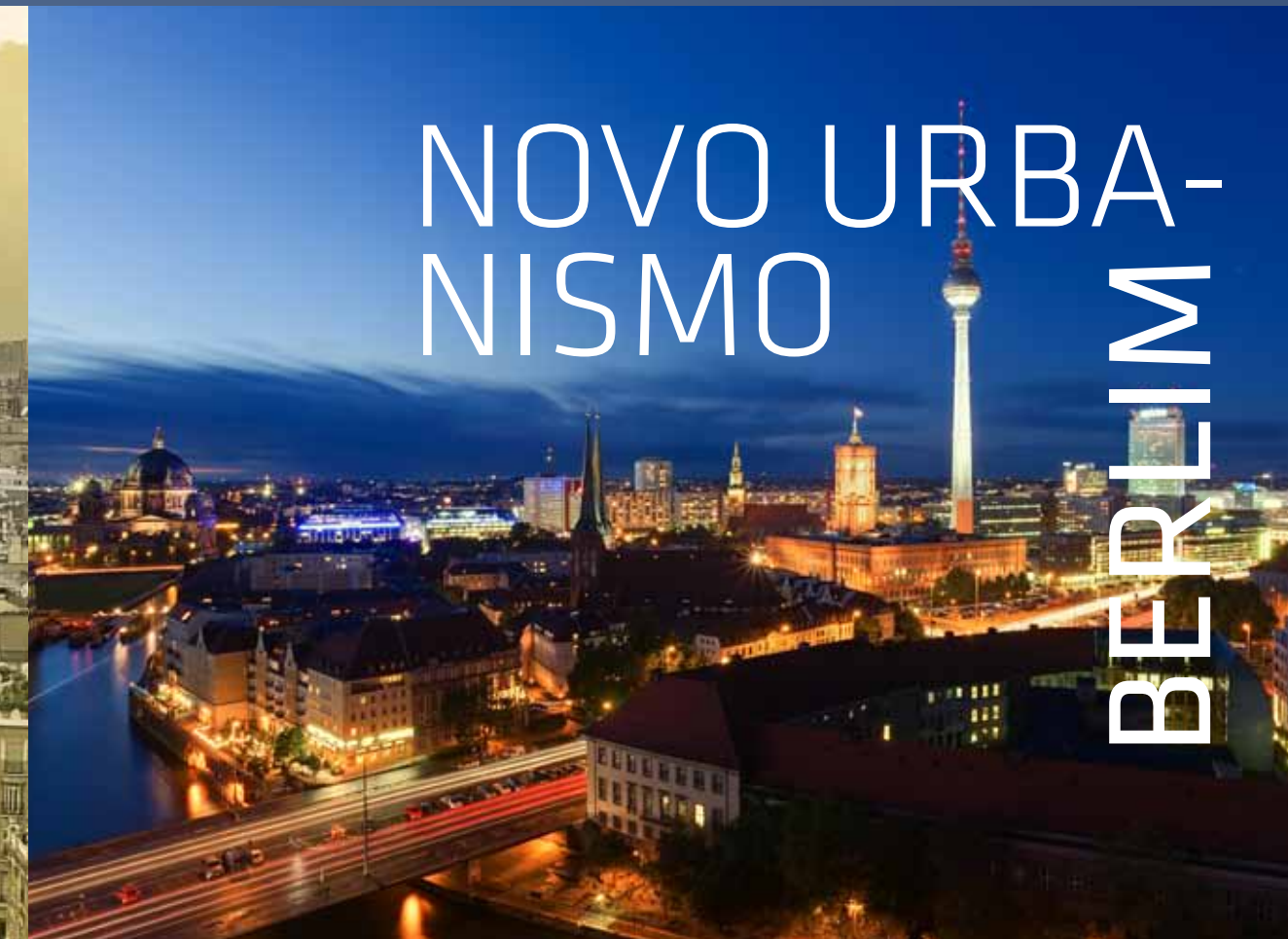
Imagem meramente ilustrativa: Berlim

Ser inusitado é ser autêntico, é inovar e transformar a paisagem. Dar lugar ao novo e ditar novas tendências. É surpreender. Impactar arquitetonicamente. Transformar o abstrato em concreto. Na sua mais perfeita forma. É arte. É design. É conceito. É se inspirar na elegância clássica, no estilo, na charmosa e harmônica concepção dos traços. É ser ágil, planejado para proporcionar amplitude às pessoas e à urbanização, aproximando cada vez mais a cidade às paisagens naturais.