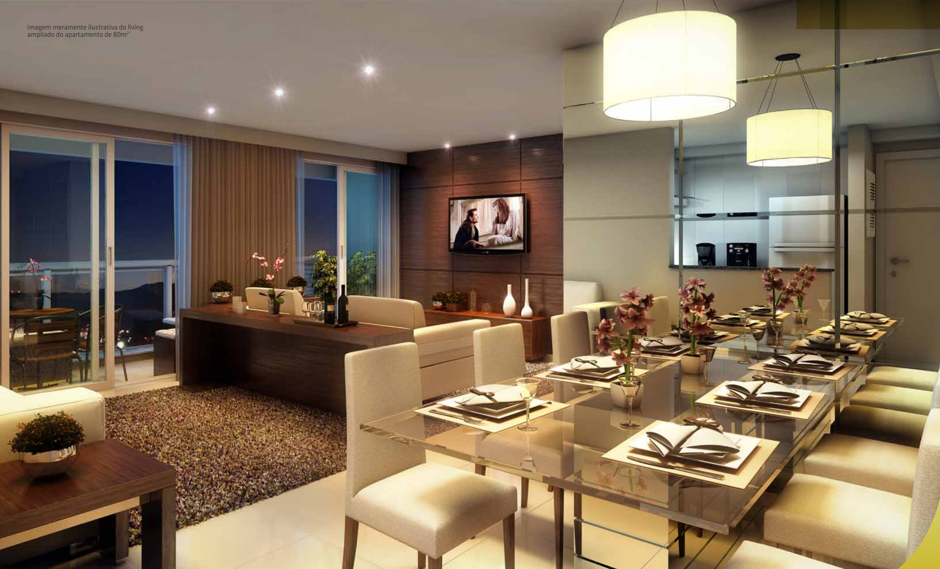
imagem meramente ilustrativa do living ampliado do apartamento de 80m 2