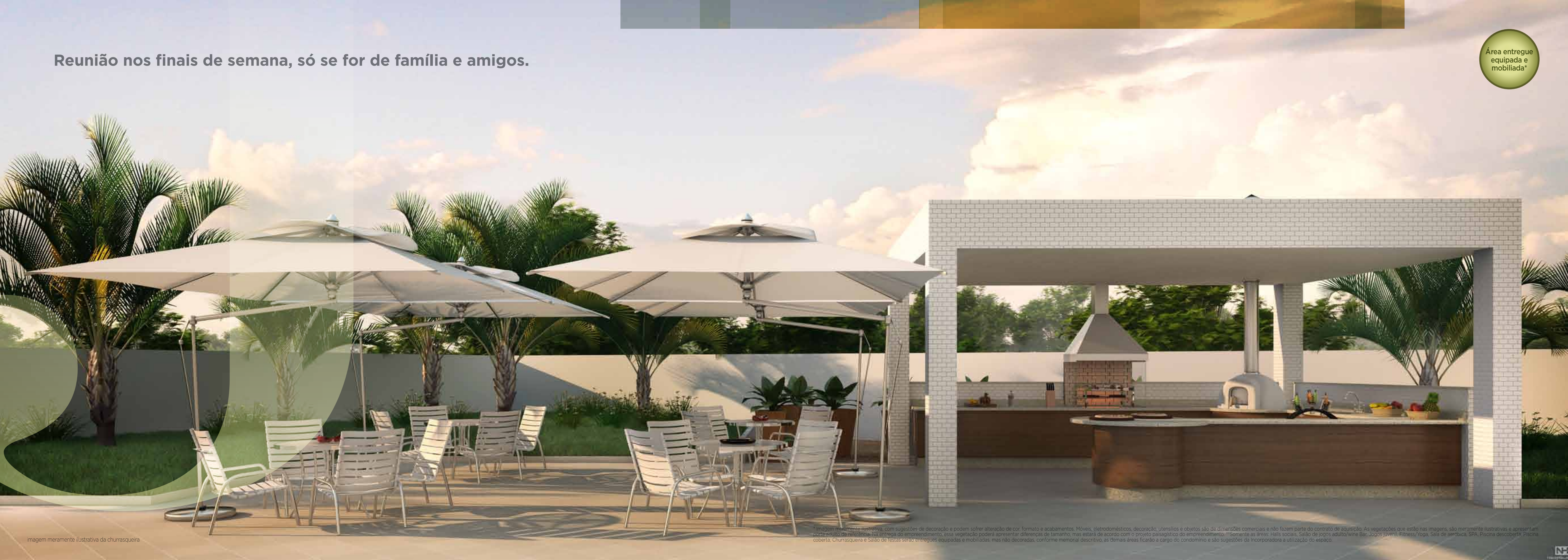
imagem meramente ilustrativa da churrasqueira

* Imagem meramente ilustrativa, com sugestões de decoração e podem sofrer alteração de cor, formato e acabamentos. Móveis, eletrodomésticos, decoração, utensílios e objetos são de dimensões comerciais e não fazem parte do contrato de aquisição. As vegetações que estão nas imagens, são meramente ilustrativas e apresentam porte adulto de referência. Na entrega do empreendimento, essa vegetação poderá apresentar diferenças de tamanho, mas estará de acordo com o projeto paisagístico do empreendimento. **Somente as áreas: Halls sociais, Salão de jogos adulto/wine Bar, Jogos juvenil, Fitness/Yoga, Sala de aeróbica, SPA, Piscina descoberta, Piscina coberta, Churrasqueira e Salão de festas serão entregues equipadas e mobiliadas, mas não decoradas, conforme memorial descritivo, as demais áreas ficarão a cargo do condomínio e são sugestões da Incorporadora a utilização do espaço.