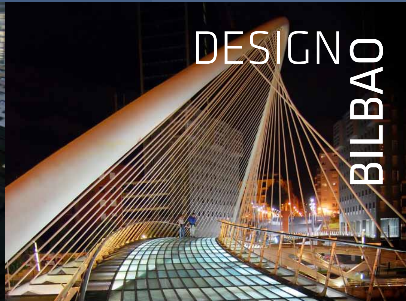
Imagem meramente ilustrativa: Bilbao