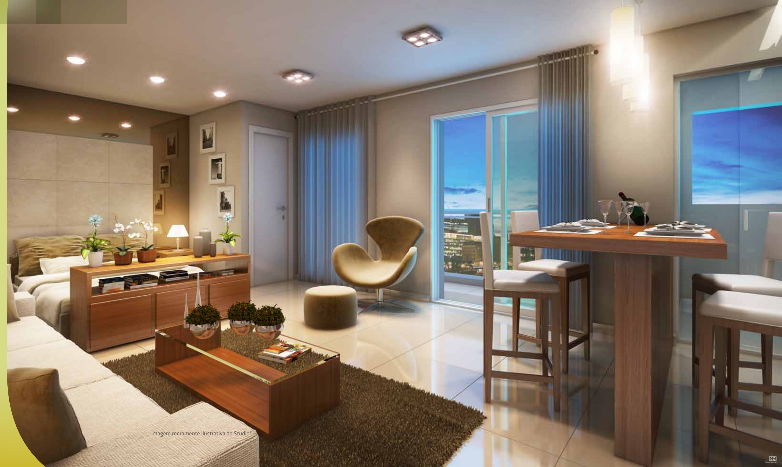
imagem meramente ilustrativa do Studio*

Viva em espaços abertos e multiplique seu conforto.