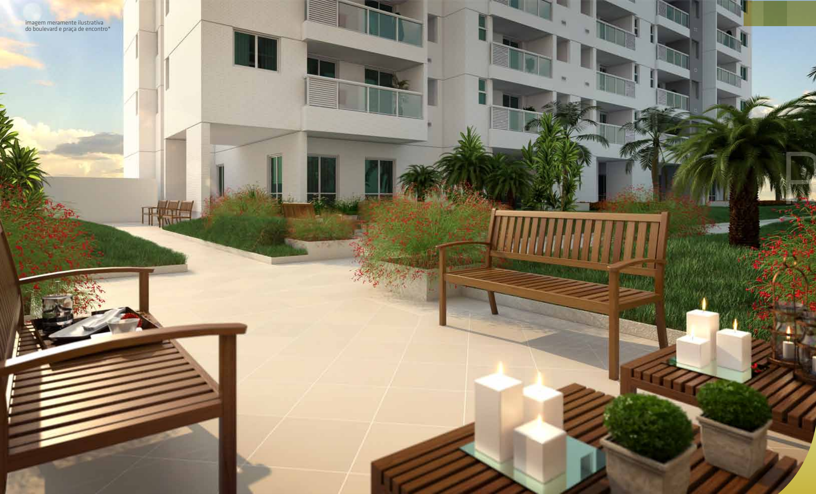
imagem meramente ilustrativa do boulevard e praça de encontro*