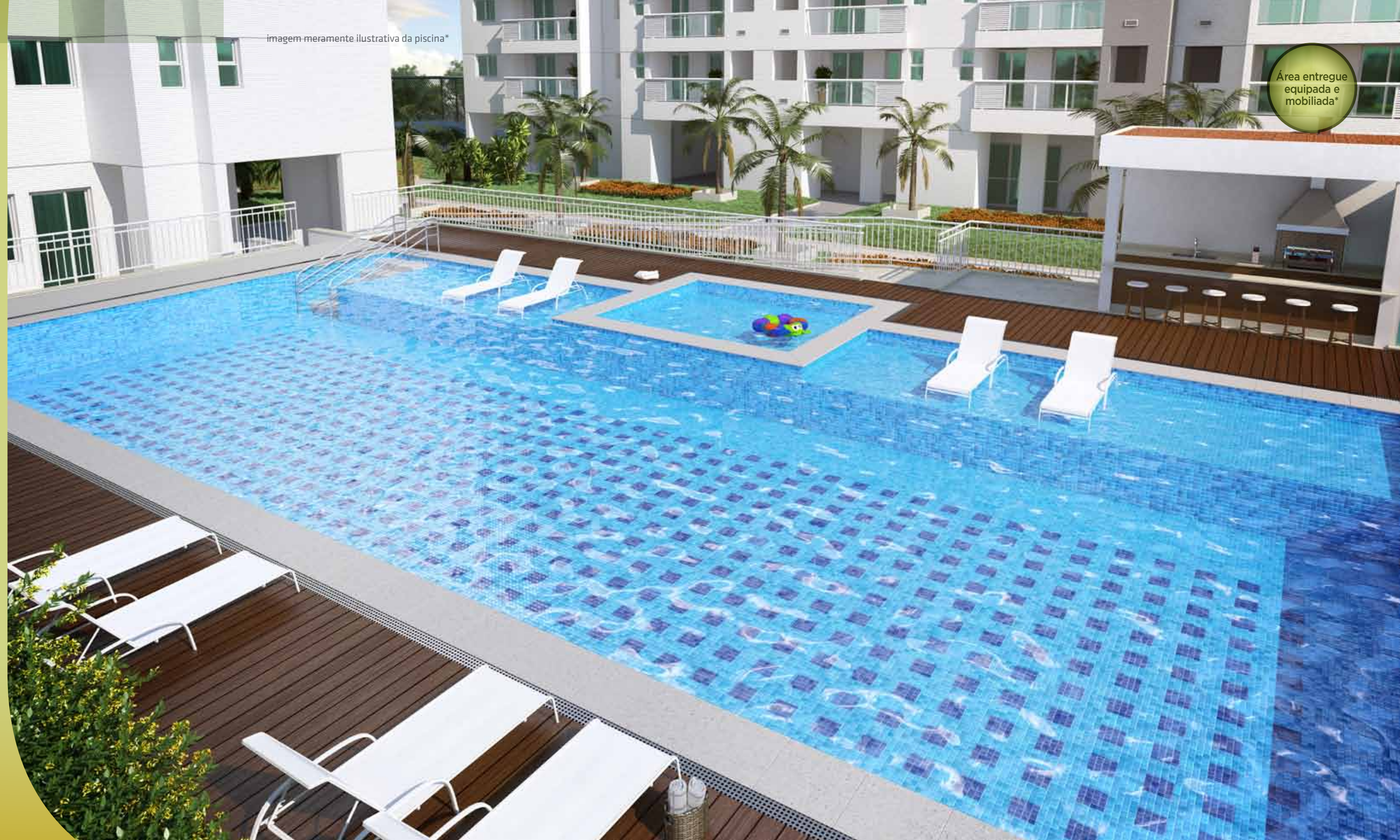
imagem meramente ilustrativa da piscina*