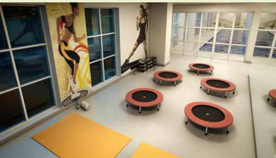
imagem meramente ilustrativa da sala aeróbica

Lindo, lindo e lindo. Pronto, você já fez sua primeira série de 3 repetições.