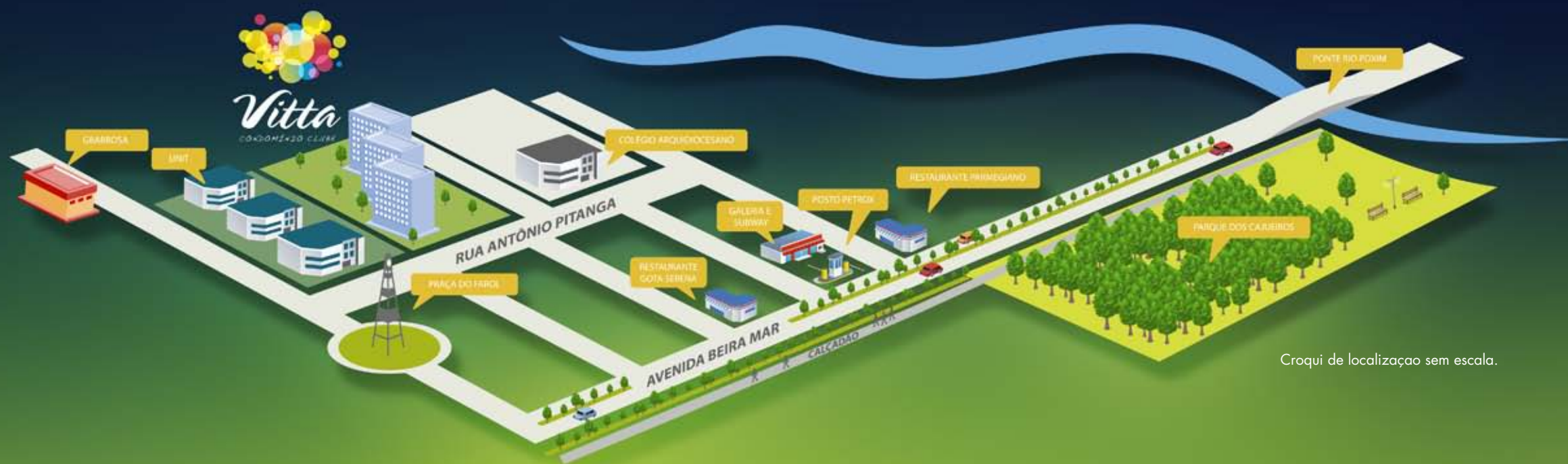
Croqui de localização sem escala.